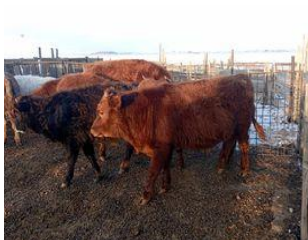
Арга хэмжээ 3.3.2.5 Арга хэмжээ 3.3.2.6